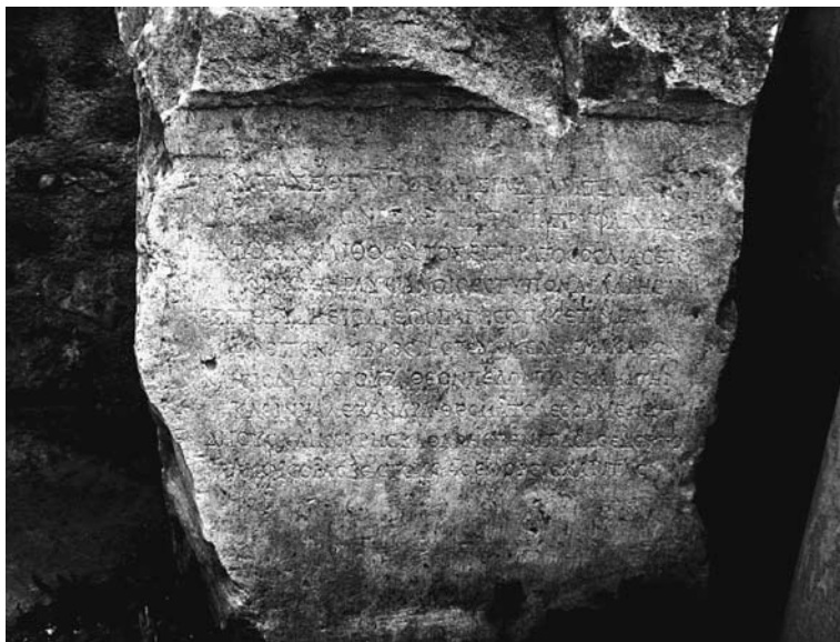
Εικ. 1. Ἡ ἐνεπίγραφη βάση (ΠΛ 1913)