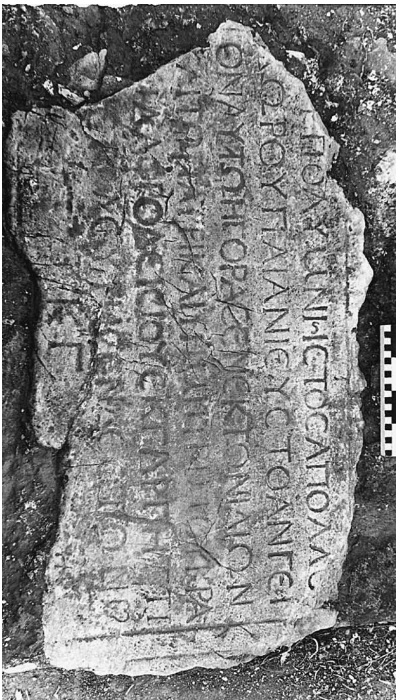
Εικ. 3. Η επιγραφή ΒΑ 1229