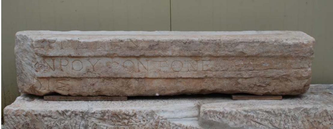
Εικ. 1: ΠΛ 2022

αδυνατώ να αποφανθώ αν το νέο επιστύλιο ανήκε σε ναό, ναϊσκόσχημο κτίσμα, ή στοά. Λόγω μεγέθους δεν θα μεταφέρθηκε στο σημείο εύρεσης από πολύ μακριά.